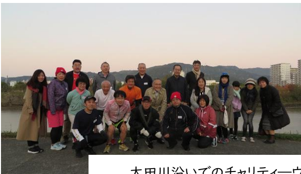
太田川沿いでチャリティーウォーク