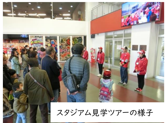
スタジアム見学ツアーの様子