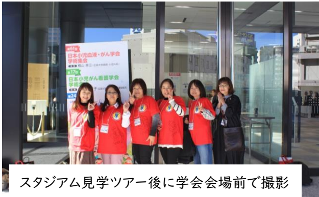
スタジアム見学ツアー後に学会会場前で撮影