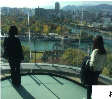
おりづるタワーにて