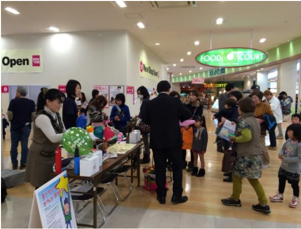
ゆめタウン久留米