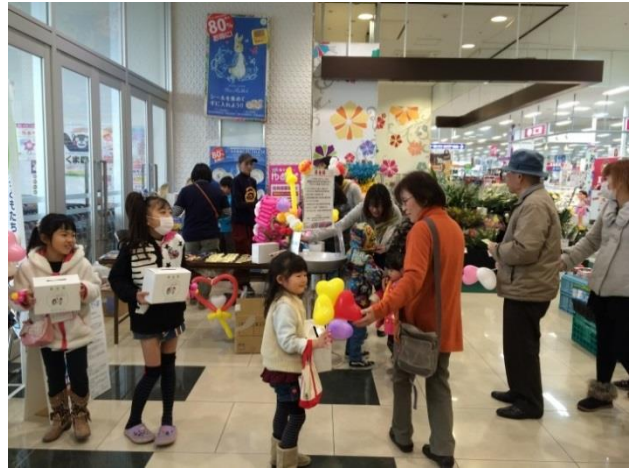
ゆめマートうきは

スタッフと、ボランティアさんのご協力とともに活動を行っているのと、さらに「私達も手伝われて下さい。」と、中学生二人も飛び入り参加でお手伝いいただきました。