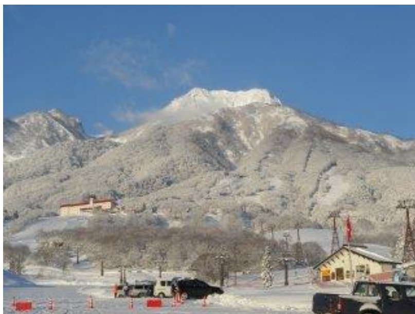
ホテルからの風景